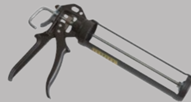
Klebepestole für Kleberpatronen