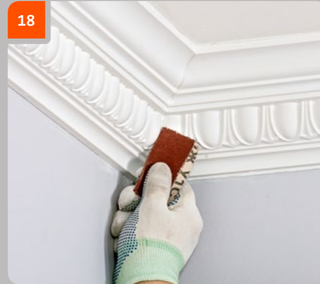
18 Nach 3 Stunden die Fugen mit feinkörnigem Schleifpapier schleifen.