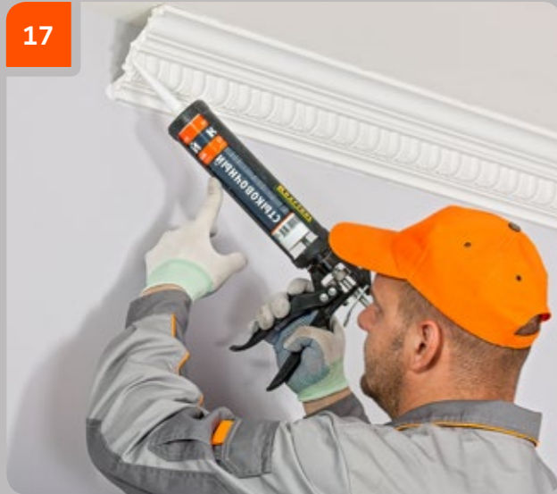
17 Fahren Sie mit der Montage des nächsten Gesimses fort.