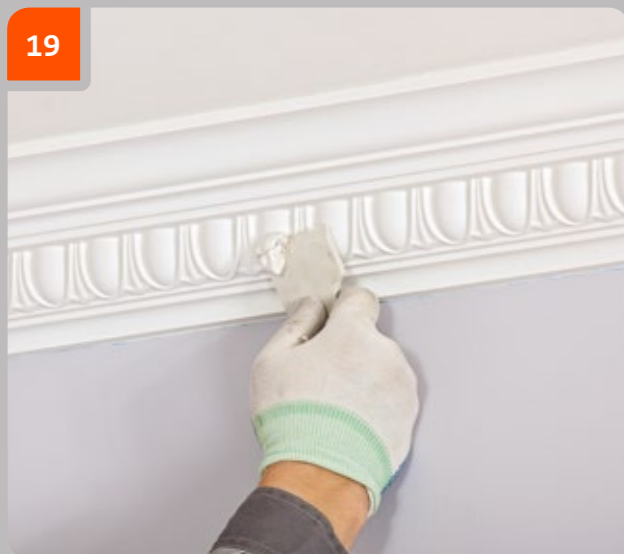
19 Füllen Sie die behandelte Fläche mit einer feinkörnigen, wasserlöslichen Spachtelmasse für den Innenausbau und wiederholen Sie ggf. Schritt 18, bis eine ebene Oberfläche entsteht.