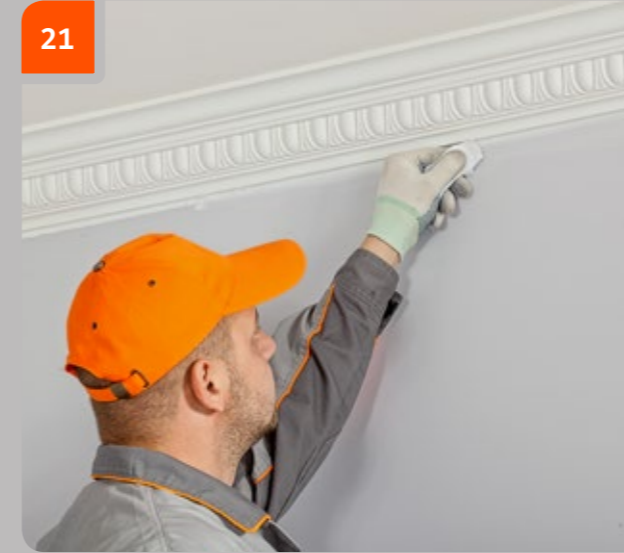
21 Überschüssigen Kleber mit einem mit Aceton benetzten Tuch entfernen.