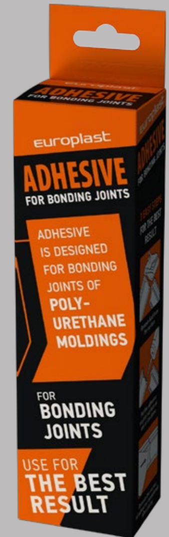
ADHESIVE FOR BONDING JOINTS 60 ml

Die angegebenen Einwirkungszeiten gelten nur für den Einsatz von Evroplast Kleber-Produktreihe. Wenn Sie Kleber von anderen Marken verwenden, folgen Sie den Herstelleranweisungen auf der Packung des jeweiligen Produkts.