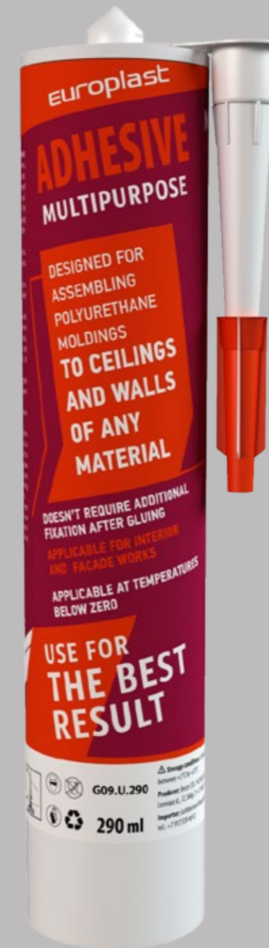
MULTIPURPOSE ADHESIVE 290 ml