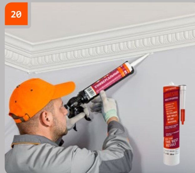
20 Mit «Evroplast Multipurpose» die Zwischenräume im Fugenbereich zwischen Gesims und Wänden/Decke ausfüllen, wo der Kleber nicht aus der Fuge ausgetreten ist.