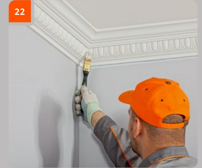
22 Das Gesims gemäß den Anweisungen des Farbherstellers von den Ecken der Elemente (Raum) aus anstreichen.