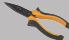
Pince à mâchoires rondes