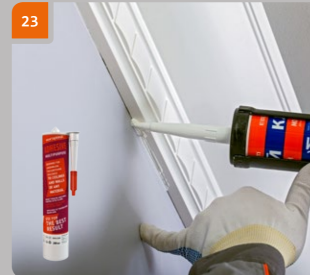
23 Remplir les espaces du joint entre la corniche et le mur et le plafond où la colle n'est ressortie du joint.