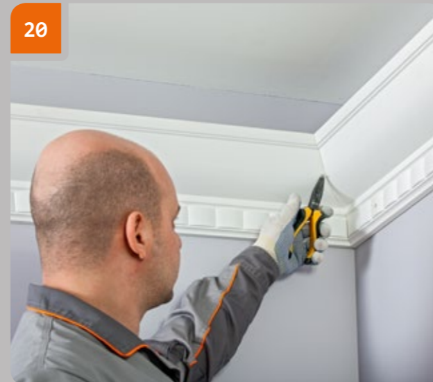
20 Attendre 3 heures et retirer les agrafes.