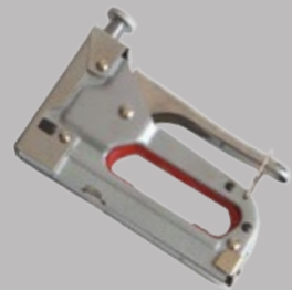
Agrafeuse de chantier