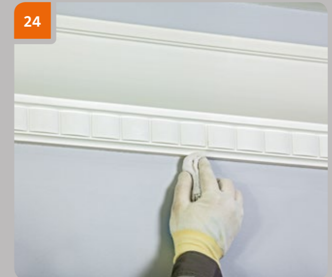
24 Essuyer la zone du joint avec un chiffon mouillé. Mouiller le chiffon avec de l'eau si de la colle Assembly a été utilisée, et avec de l'acétone si de la colle «Evropalst Multipurpose» ou «Evropalst for bonding joints».