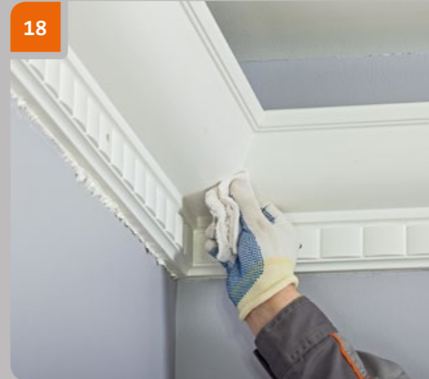
18 Essuyer la zone du joint avec un chiffon mouillé. Mouiller le chiffon avec de l'eau si de la colle Assembly a été utilisée, et avec de l'acétone si de la colle Multipurpose ou Adhesive pour les joints.