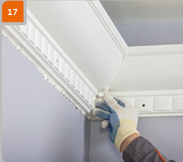
17 Retirer l'excès de colle avec une spatule immédiatement après le collage.