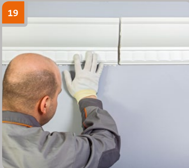
19 Continuer l'installation de la corniche suivante.