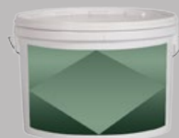
Mastic hydro-soluble à grain fin