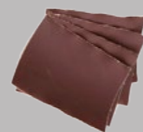
Papier abrasif à grain fin