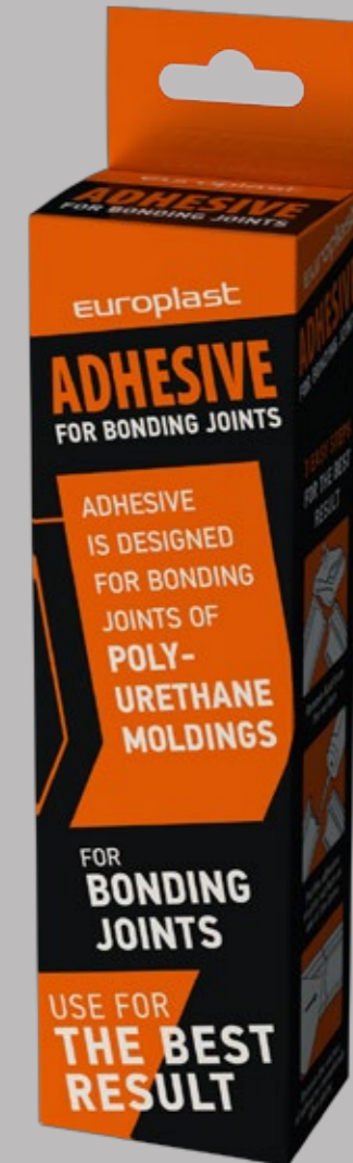
ADHESIVE FOR BONDING JOINTS 60 ml

Les intervalles de temps indiqués ne sont applicables que pour la gamme des colles de Evroplast. Si vous utilisez une colle d'un autre fabricant, suivez les instructions sur son emballage.