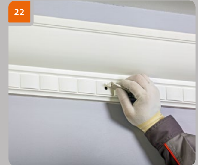
22 Remplir la zone traitée où vous avez utilisé des vis auto-foreuses avec du mastic fin soluble à l'eau pour les travaux intérieurs. Attendre 60 minutes et répéter l'étape 21 le cas échéant jusqu'à obtenir une surface plane.