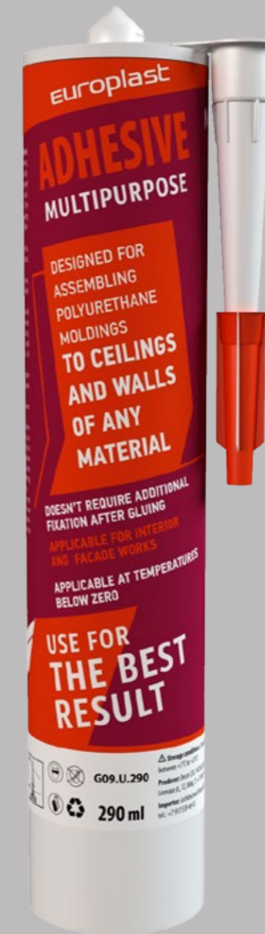
MULTIPURPOSE ADHESIVE 290 ml