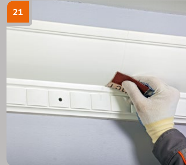
21 Traiter la zone de joint avec du papier abrasif fin pour obtenir une surface lisse.